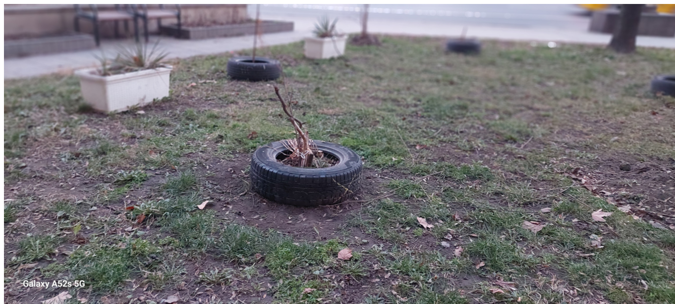
Galaxy A52s 5G