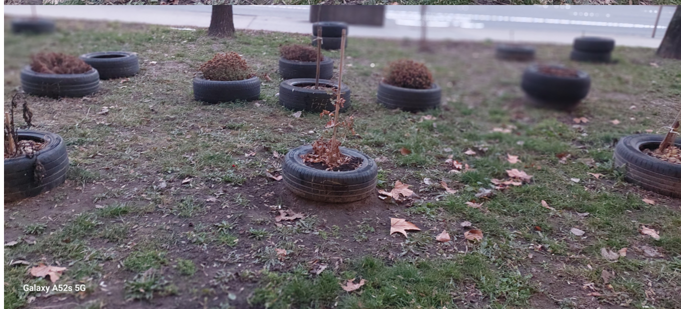
Galaxy A52s 5G