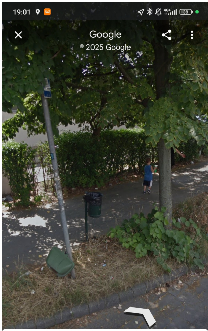
9 Hős u.